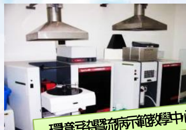
環境空氣監測示範教學中心