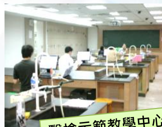
醫檢示範教學中心