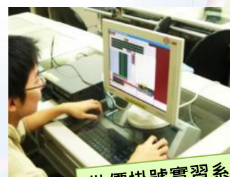
批價掛號實習系統