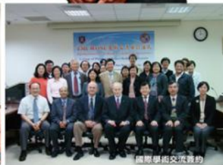
國際學術交流簽約