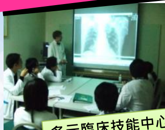
多元臨床技能中心