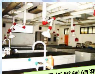
氣象層析質譜偵測